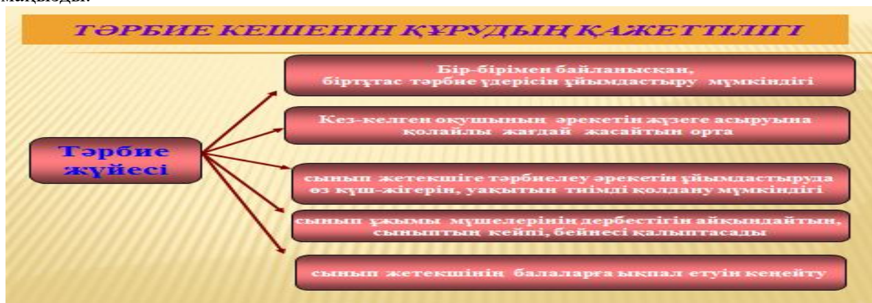
2-сурет. Тәрбие жүйесінің кешенділігі

Тәрбие жүйесін қолдану тәрбие үдерісінің мақсатқа сәйкес, басқарылатын, нәтижелі, тиімді болып қалыптасуына әсерін тигізеді. Тәрбие үдерісінің рөлі білім беру жүйесі үшін өте маңызды.